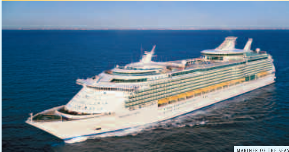
MARINER OF THE SEAS